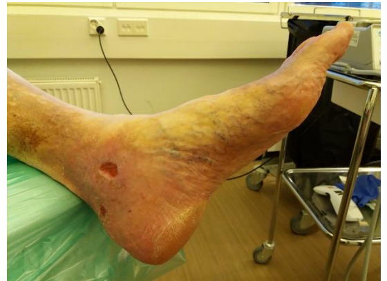
Kuva ennen Laserhoidon aloitusta

Laseria annettiin haavalle hoitojakson aikana kaksi kertaa viikossa kahden minuutin ajan muun haavanhoidon yhteydessä. Jalkaturvotusta eikä haavakipua esiintynyt haavalla hoidon alkaessa, eikä hoidon edetessä.