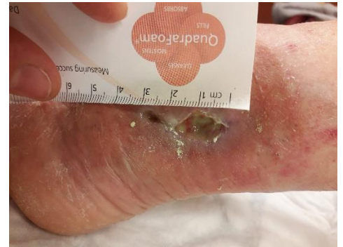
24.7. Ei edistystä hoidosta huolimatta, 26.7. haava tuoksahtaa, viljely osoittaa Aureusta.

5.10. potilaan haava jo sen verran vähemmän kivulias, ettei puudutusta enää puhdistuksen yhteydessä tarvittu. Kertoo myös laseroinnin jälkeen haava-alueelle tulevan kihelmöivä tunne.