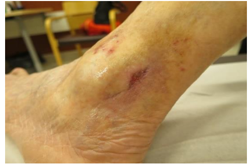
28.10. Kyretoitu haavan päältä kuiva kerros pois

31.10 Viimeinen laserointi potilaalle. Laser oli siis käytössä potilaan haavalle kuukauden ajan, ja tänä aikana haavassa tapahtui huomattavaa parannusta, haavan pieneni, oli vähemmän kivulias ja eritti vähemmän.