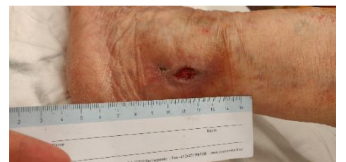
30.9. Haava puhdistuksen jälkeen