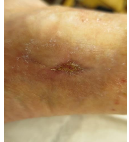
31.10. Viimeinen haavahoito laserilla

Potilas itse oli oikein tyytyväinen laserhoitoon. Laserin käyttöönoton myötä kivut haavalla alkoivat heti vähentyä, eikä puudutusta enää tarvittu. Kipulääkkeiden määrä väheni. Haava alkoi heti nopeasti pienenemään.