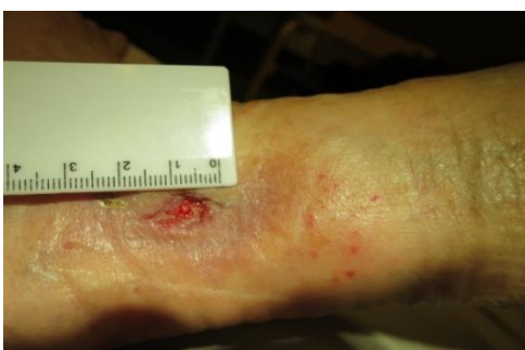
4.10. 2pv Laserhoidon aloittamisen jälkeen